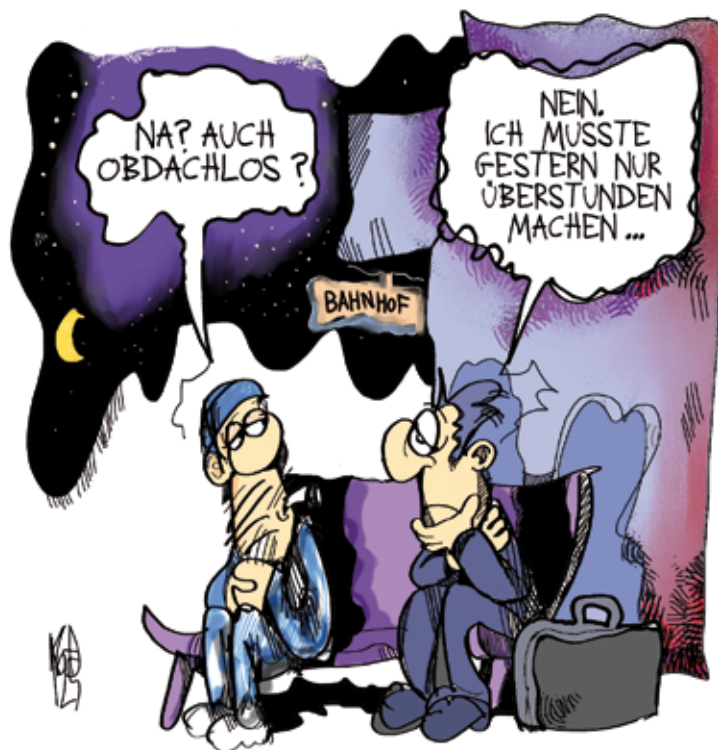
Karikatur: Kostas Koufogiorgos