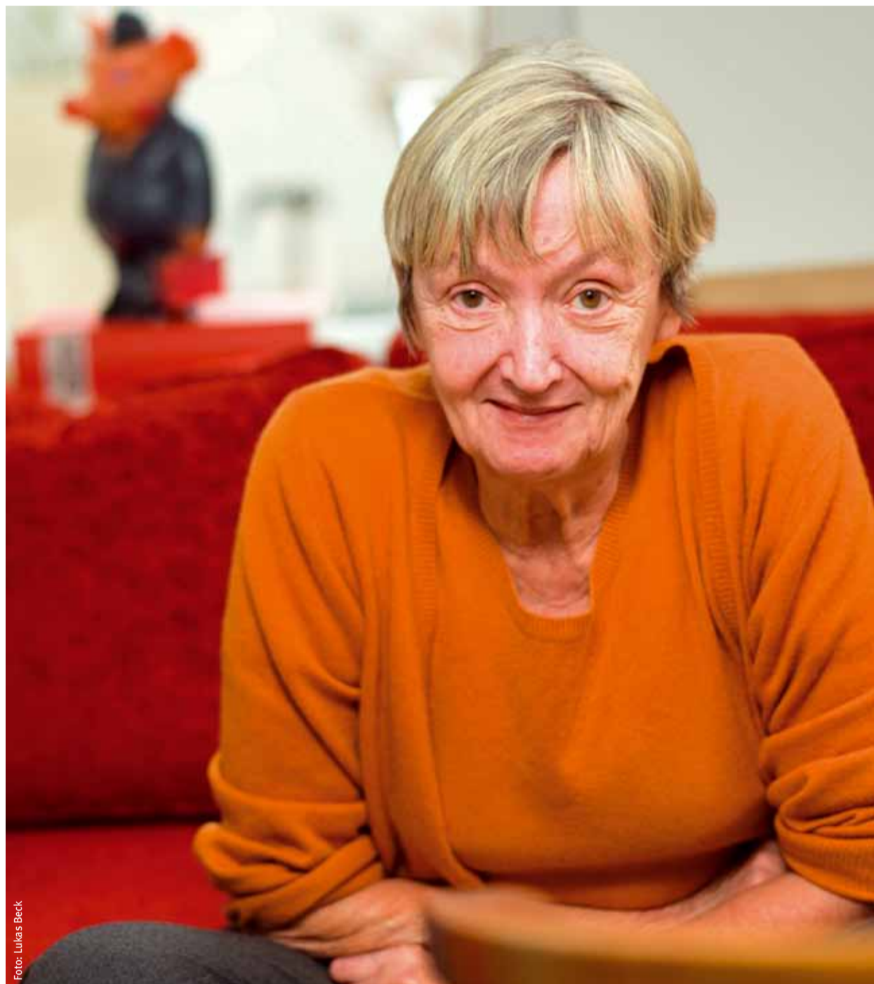
Christine Nöstlinger, geboren 1936, zählt mit über 100 Büchern zu den bekanntesten Kinder- und JugendbuchautorInnen des deutschen Sprachraums. Das Werk der Wienerin wurde in zahlreiche Sprachen übersetzt und mit international renommierten Preisen ausgezeichnet.

vida: Bekommen Sie Rückmeldungen, ob eher Buben oder