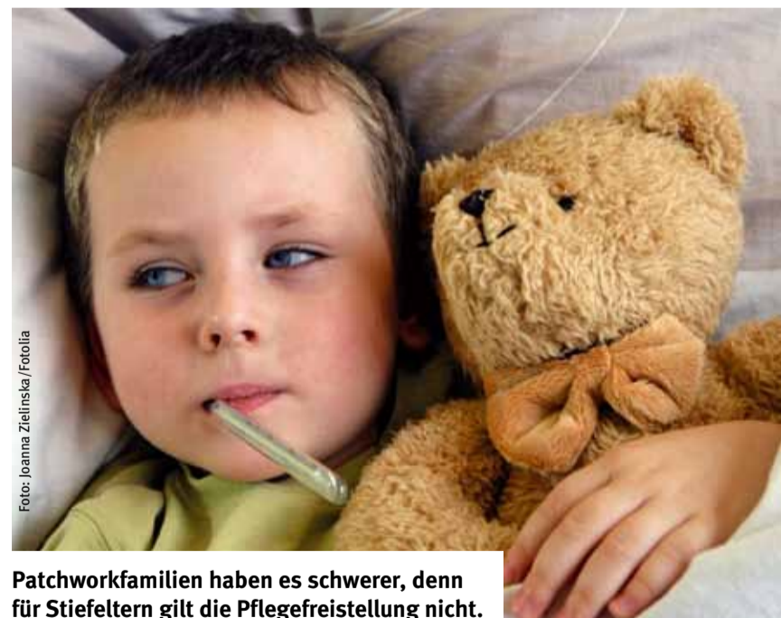
Patchworkfamilien haben es schwerer, denn für Stiefeltern gilt die Pflegefreistellung nicht.

Lücken im Gesetz. Kein Anrecht auf Pflegefreistellung haben Väter bzw. Mütter, die nicht im gemeinsamen Haushalt mit ihren Kindern leben.