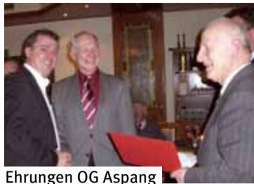
Ehrungen OG Aspang

OG ASPANG: Volles Haus herrschte bei der am 17.12.2010 im GH Baumgartner statt-