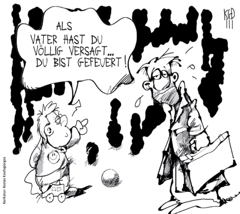
Karikatur: Kostas Koufogiorgos

Gegensteuern. Bleibt zu hoffen, dass die Führungsebene aus diesen Fehlern lernt. Die Konkurrenz – Stichwort WESTbahn ab Dezember 2011 – setzt auf ausreichend ZugbegleiterInnen und guten Service in den Waggons. Auch die ÖBB-MitarbeiterInnen wollen exzellenten Service bieten – Voraussetzung dafür ist, dass man sie arbeiten lässt! (mf)