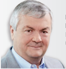
DR. JOHANN KALLIAUER Präsident der AK Oberösterreich

B einige jede/r vierte Beschäftigte in Österreich hat einen All-In-Vertrag, das heißt: einen Arbeitsvertrag, in dem sämtliche arbeitsrechtlichen Ansprüche pauschal abgegolten werden. Und mit dem die Grenzen zwischen Arbeitszeit und Freizeit verschwimmen, weil die Beschäftigten allzeit für ihre Arbeitgeber bereit sind – in der Freizeit, im Urlaub und auch im Krankenstand.