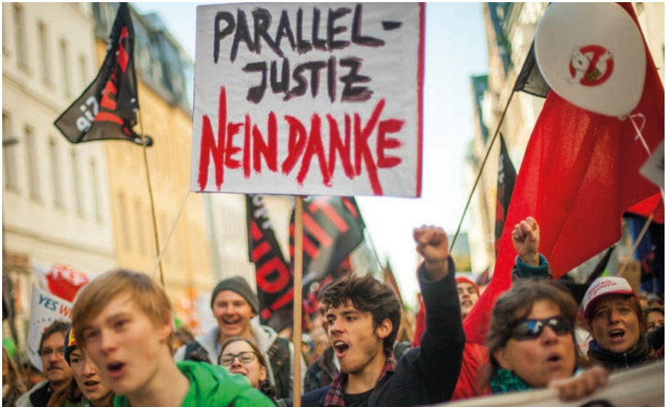
„TTIP & CETA stoppen! Für einen gerechten Welthandel“ – Großdemonstration am 10. Oktober 2015 in Berlin