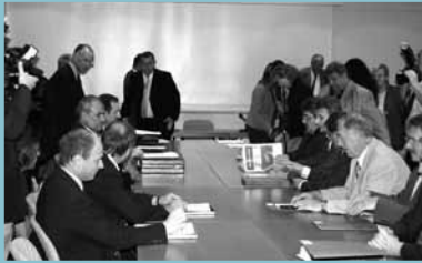
Start der Metallernlohnrunde, 2006 Beginning of collective bargaining in the metal sector, 2006 Négociations des salaires des travailleurs métallurgiques, 2006 Начало переговоров по вопросу оплаты труда металлургов в 2006 году

Экономические элиты на основе национального консенсуса в послевоенный период взялись за восстановление частично разрушенной хозяйственной инфраструктуры. Следование принципам социального диалога привело в 1950 г. к отказу от проведения односторонних неолиберальных хозяйственных реформ. В последующие годы стремление к взаимному согласованию интересов между работодателями и наемными работниками распространилось и на другие сферы и стало также распространяться на иные общественно-политические вопросы, такие, как рост экономики, равноправие, образование, интеграция и др.