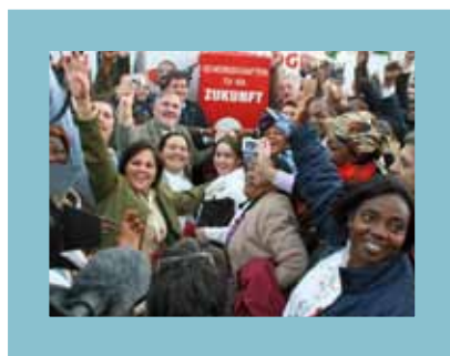
IGB-Gründungskongress in Wien, 2006 ITUC Congress in Vienna, 2006 Congrès du CIS à Vienne, 2006 Конгресс МКСП в Вене в 2006 г.