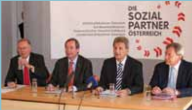
Dialog der Sozialpartner Social partnership dialog Dialogue des Partenaires Sociaux Председатель ОАП Эрих Фоглар на федеральном съезде ОАП в 2009 году

Экономические элиты на основе национального консенсуса в послевоенный период взялись за восстановление частично разрушенной хозяйственной инфраструктуры. Следование принципам социального диалога привело в 1950 г. к отказу от проведения односторонних неолиберальных хозяйственных реформ. В последующие годы стремление к взаимному согласованию интересов между работодателями и наемными работниками распространилось и на другие сферы и стало также распространяться на иные общественно-политические вопросы, такие, как рост экономики, равноправие, образование, интеграция и др.