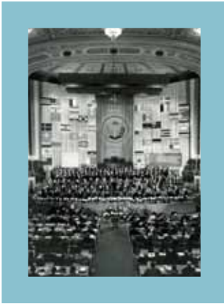
IBFG-Kongress in Wien, 1955 ICFTU Congress in Vienna, 1955 Congrès du CISL à Vienne, 1955 Съезд МКСП в Вене в 1955 году

Будучи профсоюзами небольшой по европейским и глобальным меркам страны, подверженной сильному влиянию извне, мы придаем большое значение международному сотрудничеству. Поэтому на сегодняшний день международные связи ОАП отличаются большим разнообразием.