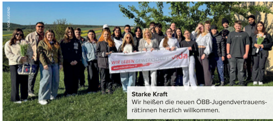
Starke Kraft Wir heißen die neuen ÖBB-Jugendvertrauensrät:innen herzlich willkommen.