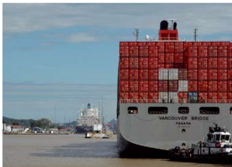
Fehlende gesetzliche Regelungen machen das kleine Panama zum stolzen Herrn über fast 5.800 Hochseeschiffe.

Weitere Informationen zur Verkehrsinfrastrukturpolitik finden Sie im Internet unter: http://wien.arbeiterkammer.at/www-4050.html