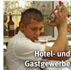
Hotel- und Gastgewerbe

Mit Mai steigen die Löhne für die Beschäftigten im Hotel und Gastgewerbe . Die Gewerkschaft vida hat bei den Kollektivvertragsverhandlungen ein Plus von 3,4 Prozent erreicht.